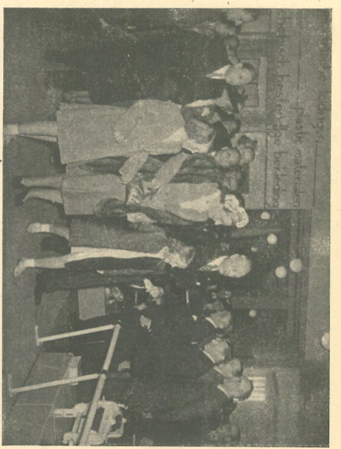
Op de openingsdag bezocht H.M. de Koningin met de prinsesjes Beatrix en Irene de Jaarbeurs. Hier ziet u het Koninklijk gezelschap bij de eerste stand van STOKVIS.